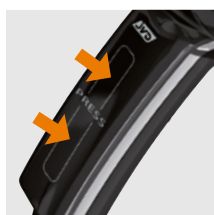
SISTEMA DE ENCENDIDO PATENTADO